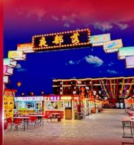
ตลาดกลางคืน ตาลาเดอซี