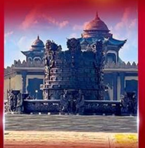
ศูนย์วัฒนธรรม มองโกเลีย หยวนหลิว