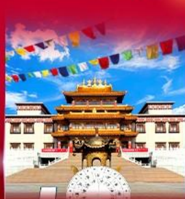
วัดพระโพธิสัตว์ ดูลาน