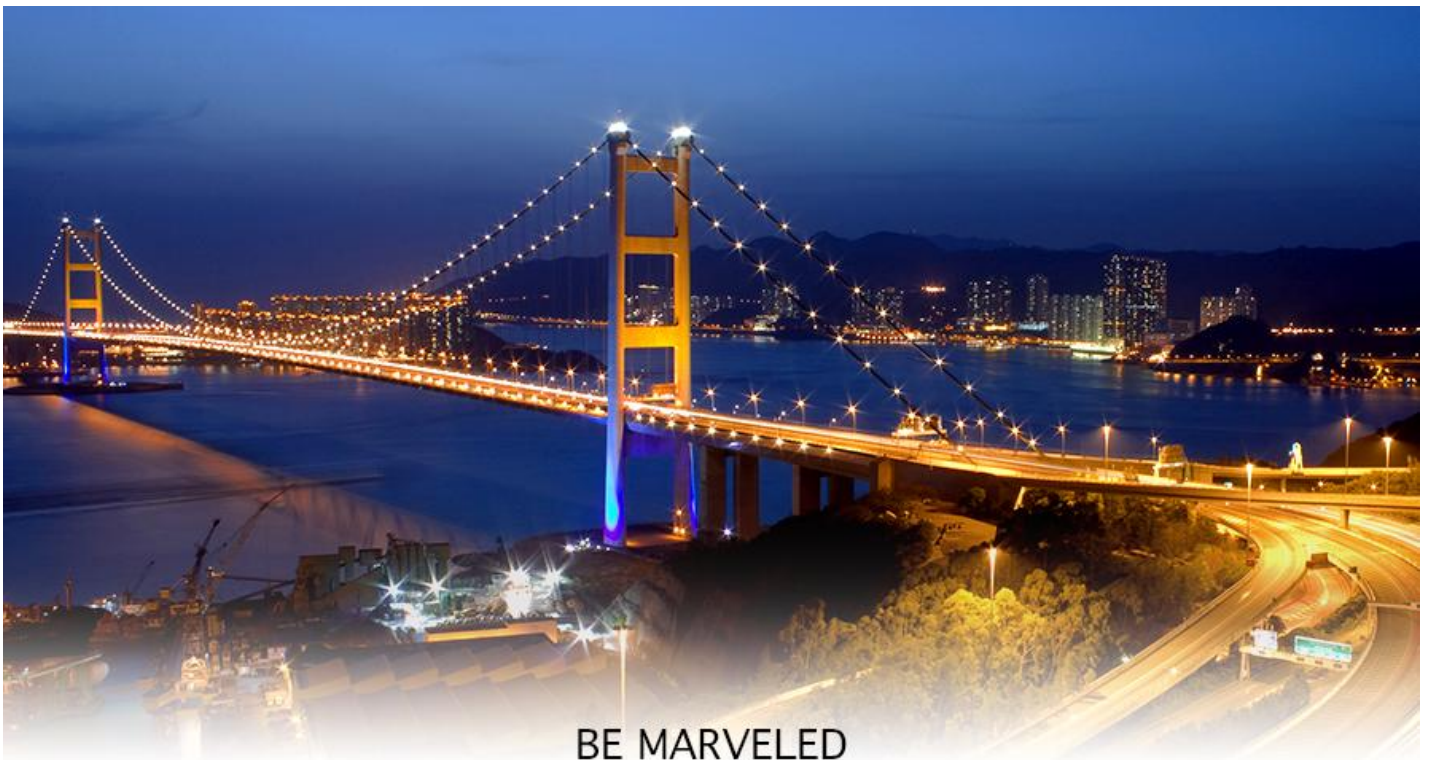
BE MARVELED สะพานแขวนชิงหม่า

17.40 น. เดินทางถึง สนามบินเซ็กแล็บก๊อก (CHEK LAP KOK INTERNATIONAL AIRPORT) เขตปกครองพิเศษฮ่องกง หลังผ่านพิธีการตรวจคนเข้าเมืองเป็นที่เรียบร้อยแล้ว รับกระเป๋าสัมภาระ เดินทางโดยรถโค้ชปรับอากาศ (เวลาที่ท้องถิ่นที่ฮ่องกง เร็วกว่าประเทศไทย 1 ชั่วโมง)