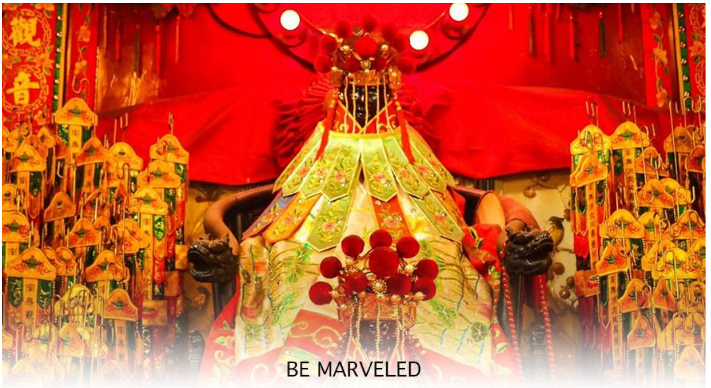
BE MARVELED วัดเจ้าแม่กวนอิมฮ่องกง (ยืมเงิน)

จากนั้นนำท่านสู่ เจ้าแม่กวนอิม วัดสองอำ (HUNG HOM KWUN YUM TEMPLE) เป็นหนึ่งในวัดที่เก่าแก่ที่สุดของฮ่องกง และชาวฮ่องกงเลื่อมใสกันมาก สร้างขึ้นในปี ค.ศ.1873 ในสมัยช่วงสงครามโลกครั้งที่ 2 มีการปล่อยระเบิดลงบริเวณใกล้กับวัดแห่งนี้หลายต่อหลายครั้ง ทำให้มีผู้บาดเจ็บและล้มตายนับไม่ถ้วน แต่ชาวบ้านที่หนีเข้าไปหลบภัยในวัดนี้กลับปลอดภัยอย่างปาฏิหาริย์ และตัววัดก็ไม่ได้รับความเสียหายจากเหตุการณ์ทิ้งระเบิดที่น่าอัศจรรย์ ตามความเชื่อของคนจีนในฮ่องกง-มาเก๊า จะมี "วันเปิดทรัพย์" หรือ "พิธียืมเงิน เจ้าแม่กวนอิมฮ่องกง" เป็นวันที่จะมาขอพรและยืมเงินเจ้าแม่กวนอิม ซึ่งนับจากหลังวันตรุษจีน ไป 26 วัน จะเป็นวันเปิดทรัพย์ที่จัดขึ้นในทุกๆปี พิธีนี้จะมีเพียงครั้งปีละครั้งเท่านั้น เป็นวันสำคัญอีกวันที่คนหลังไหลมาไหว้ขอพรอย่างไม่ขาดสาย