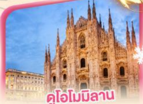
คูโอโมมิลาโน