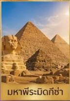
มหาพีระมิดกิซ่า