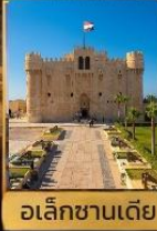
อเล็กซานเดีย