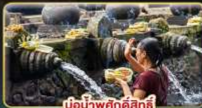
บ่อน้ำพุศักดิ์สิทธิ์