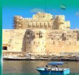
บึงปลาการ์ Qulte Bay