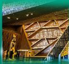
พิพิธภัณฑ์แกรนด์อียิปต์ (GEM)