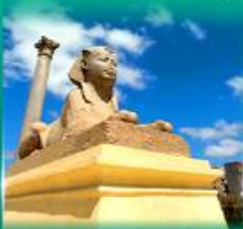
เสานินบงเบญ