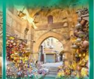
ตลาดผ่านเวลาอัลลี