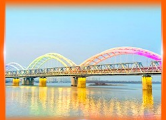
สะพานรถไฟปินโจว