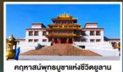
คฤหาสน์พุทธบูชาแห่งชีวิตยูลาน