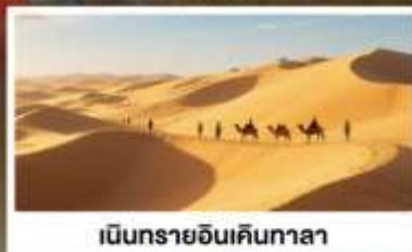
เป็นกรายอินเคินกาลา