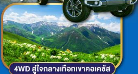
4WD สู่ใจกลางเทือกเขาคอเคซัส