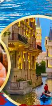
เมืองน้ำเวนิส