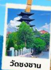
วัดชงซาน