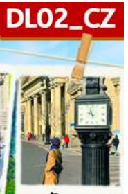
จัตุรัสสองซาน