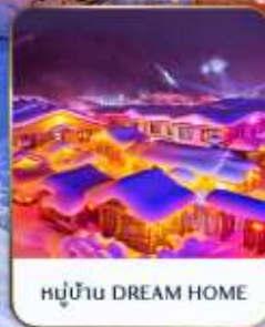
หมู่บ้าน DREAM HOME