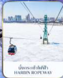
บึงกระเต้าไฟฟ้า HARBIN ROPEWAY