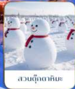
สวนตุ๊กตาหิมะ