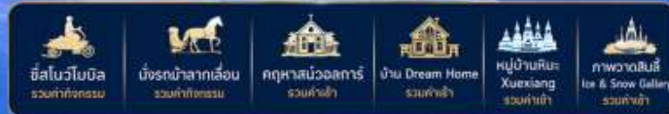
สเก็ตน้ำแข็ง รวมค่าจ้างรถ