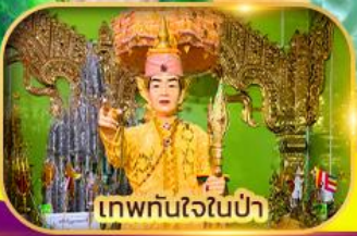
เทพทันใจในป่า