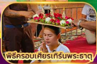
พิธีครอบเศียรเทิร์นพระธาตุ