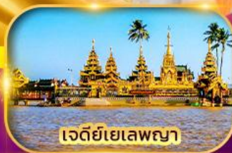
เจดีย์เยเลพญา