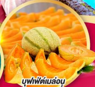
บุฟเฟ่ต์เมล่อน หอม หวาน ฉ่ำ