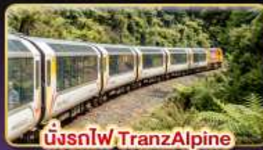
นั่งรถไฟ TranzAlpine