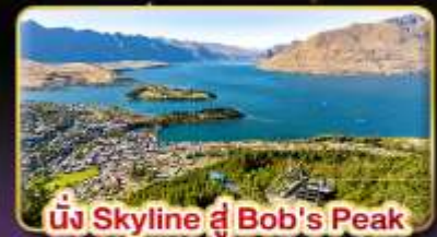
นั่ง Skyline ฟู Bob's Peak