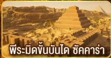
พีระมิดขั้นบันได ชัคคาร์่า