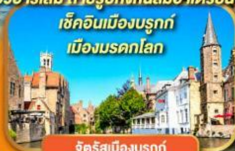
จัตุรัสเมืองบรุคก์