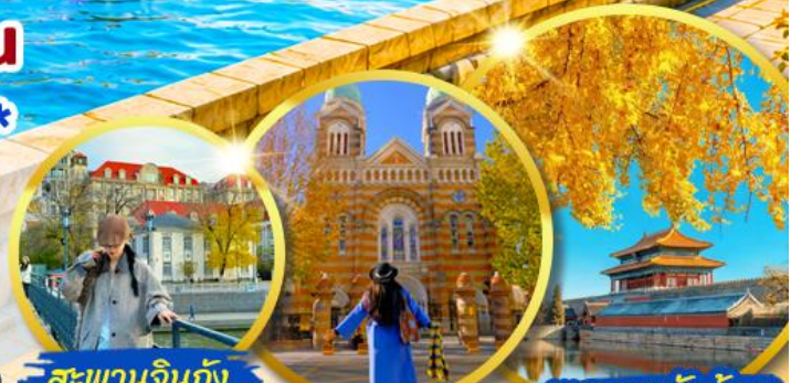
สะพานจินถิง