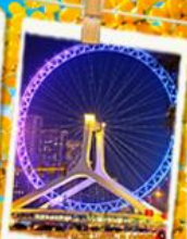
เทียนจินอาย