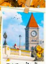
สะพานเป่ย์อัน