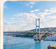
BOSPHORUS STRAIT ช่องแคบบอสฟอรัส