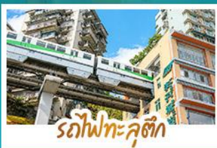
รถไฟกะลูดี้