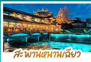
สะพานหนามเดียว

เช็กอิน "ภูเขาสี่ฤดู" ชมทิวทัศน์ภูเขาหิมะติดกับผืนป่าสุดอลังการ ชมแสงสีสุดโรแมนติก BLUE TEARS ณ สะพานหนามเดียว นั่งรถไฟความเร็วสูง เชื่อม 2 มหานคร เจียงตู - ฉงชิ่ง ถ่ายภาพรถไฟกะลูดี้ แลนด์มาร์กดังแห่งฉงชิ่ง เช็กอินจุดชมวิว LIGHT OF COPPER วิวยามค่ำคืนสุดตระการตา