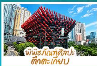
พิพิธภัณฑ์ศิลปะ ฮักตงเกียบ