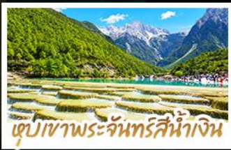
เขุบเขาพระจันทร์สีน้ำเงิน