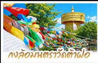
วงล้อมนตราวัดต้าฝอ

ถ่ายรูป MOOD ที่ใช้กับวิวทะเลสาบเอ๋อร์ไห่สุดโรแมนติก • ชมดอกไม้ตามฤดูกาลกลางขุนเขา ณ สวนอวาลู่อว้าง พิศดูภูเขาหิมะมังกรหยกความสูงกว่า 4,506 เมตร (รวมกระเช้าใหญ่ไป-กลับ) • นั่งรถไฟชมวิวภูเขาหิมะมังกรหยก ชนวิญแบบพาโนรามา • เที่ยวเมืองโบราณต้าหลี่ ลี้เจียง แซงกรี่ล่า ซิม ซื่อปี้ สะพานวัฒนธรรมยูนนานกับเบต ชมธารน้ำขาวไปสู่อุ้งไถ UNSEEN เมืองจื๊นแห่งยูนนาน • วัดลามะซำจ้านหลิน สัมผัสกลิ่นอายอารยธรรมทิเบต VOPPsกับวงล้อมมรดกที่ใหญ่ที่สุดในโลก • ช้อปปิ้งเพลิน ณ ถนนคนเดินหนานผิงเจีย & POP MART