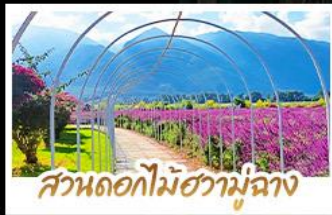
สวนดอกไม้ฮาม่ามูฉาง