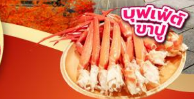
บุฟเฟ่ต์ ซาซู

เช็किनจุดถ่ายรูป ศาลเจ้าฟูจิซัง ฮงกุเซ็นเกินไทยะ