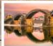
สะพานคินไตเคียว