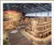
พิพิธภัณฑ์ทรายทงโดริ