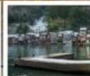
หมู่บ้านประมงฮิเมะ ฟูนายะ