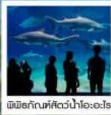
พิพิธภัณฑ์สัตว์น้ำโอเอซิส