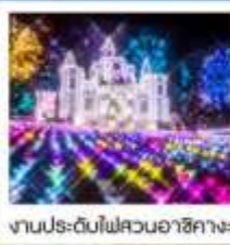
งานประดับไฟสวนอาซากะ