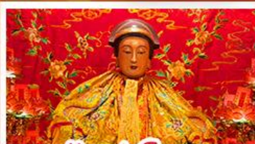
วัดเล่งจื๊อเมว