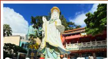
เจ้าแม่กวนอิมรัฟลัสเบย์