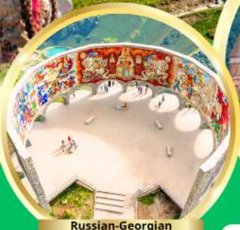
Russian-Georgian Friendship Monument