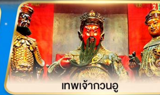
เทพเจ้ากวนอู