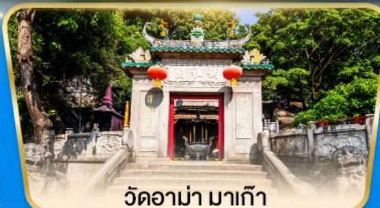
วัดอามา มาเก๊า