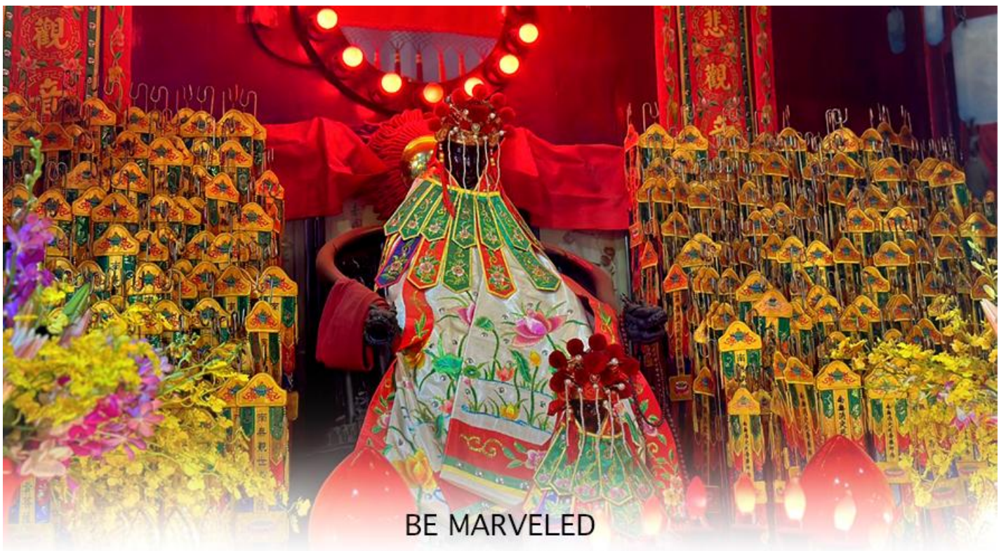
BE MARVELED วัดเจ้าแม่กวนอิมฮวงอ้า (ยิมฮิน)

ให้เดินทางกลับไปกราบไหว้ และขอบคุณเจ้าแม่กวนอิมอีกครั้ง โดยเตรียมชุดไหว้และกระดวยเงินกระดวยทองที่เป็นเหมือนเงินที่เรานำมาคืน เป็นการไหว้เพื่อคืนเงินเจ้าแม่กวนอิมนั่นเอง