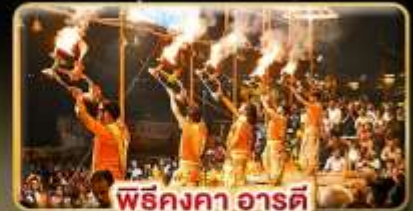
พิธีคงคา อารตี