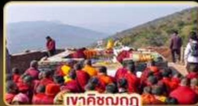
เทศกาลฌกฏ