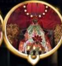
วัดเจ้าแม่กวนอิมช่องฮ่า ทอพรสูงภาพ