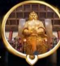
วัดเขากง ทอพรโซคลาก