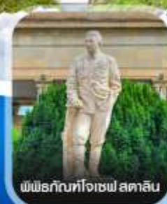
พิพิธภัณฑ์โจเซฟ สตาลิน