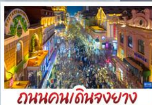
ถนนคนเดินจงยาง