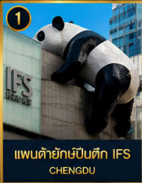
1 แพนด้ายักษ์ป็นตึก IFS CHENGDU