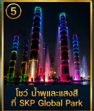
5 โชว์ น้ำพุและแสงสี ที่ SKP Global Park