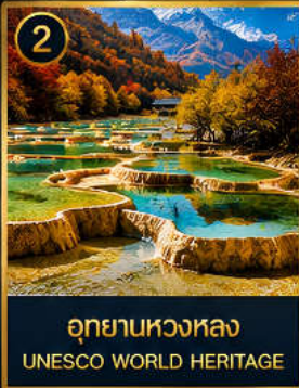
2 อุทยานหวงหลง UNESCO WORLD HERITAGE