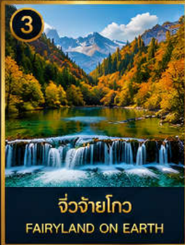
3 จิวจ้ายโกว FAIRYLAND ON EARTH