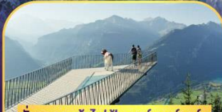
นั่งรถกระเช้าไฟฟ้า ฮาร์เตอร์ คูล์ม