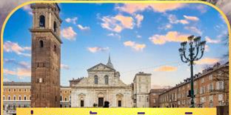
ถ่ายภาพกับมหาวิหารตูริน