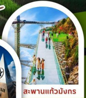
สะพานแก้วมังกร