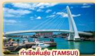
ท่าเรือคันทันซุย (TAMSUI)