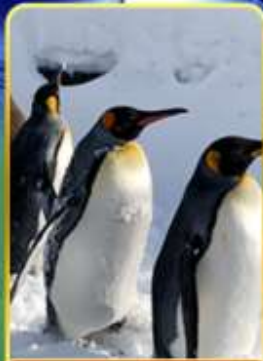
พาเหรดกเพนกวิน