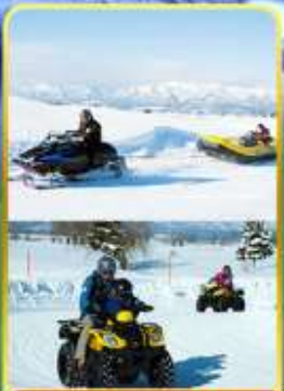
BIBAI SNOW LAND