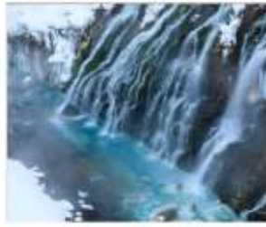
น้ำตกชิราอิเกะ