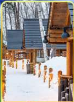
มิงเกิ้ลเกอเร