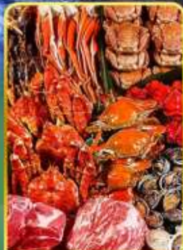
ปิ้งย่างพรีเมียมมันตะ

ออนเซ็น 2 คั้น มน.กระเป๋า 1 ใบ 23 กก 7Days 5Night