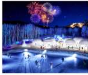
หมู่บ้านน้ำแข็งโทมามู