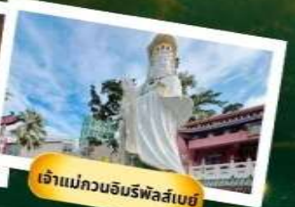
เจ้าแม่กวนอิมริพัลส์เบย์