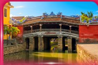
สะพานญี่ปุ่นโบราณ ฮอยอัน