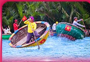
ล่องเรือกระดัง หมู่บ้านกิมทาน