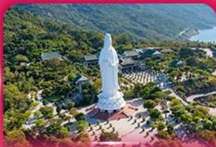
องค์กวนอิม วัดหลันอิ่ง