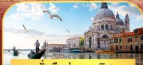
นั่งเรือสู่เกาะเวนิส