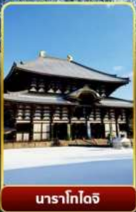
นาราโกโตจิ

พิเศษพักในเมืองคุสัทสึออนเซ็นพร้อมชมยูบาคาเกะ