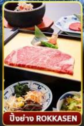
ปิ้งย่าง ROKKASEN

🌊 ออนเซ็น 3 คั้น 🧳 มน.กระเป๋า 1 ใบ 23 กก 🌞 9Days 6Night