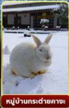
หมู่บ้านกระต่ายคางะ