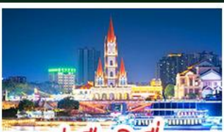
ท่าเรือกิ่งจื่อ

เขาชิงชิวสวนดอกไม้ตามฤดูกาล หมู่บ้านสไตล์ยุโรปเที่ยงวัน มังซิง เสี่ยวจิ้น ถนนคนเดิน NANNING ZHIYE - เมืองโบราณไท่ผิง ท่าเรือกิ่งจื่อ - ถนนคนเดิน สามตรอกสองซอย