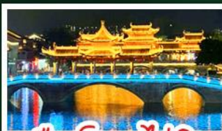
เมืองโบราณไท่ผิง