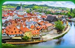
เมืองมรดกโลก เซสท์ครุมลอฟ