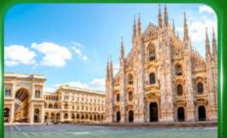
มหาวิหารดูโอโมแห่งมิลาน