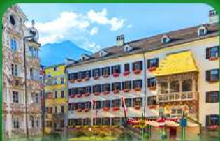
หลังคาทองคำ ซาลซ์บวร์ค