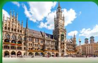
จัตุรัสมาเรียนพลัทซ์ มิวนิค