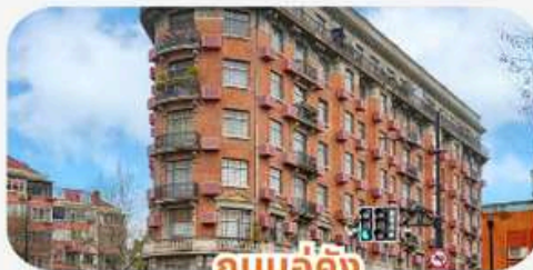
ถนนอู๋คัง