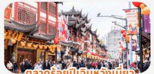
ตลาดร้อยปีเดินหวังเมี่ยว