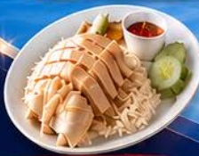
ข้าวมันไก่ปีนัง