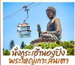
นั่งกระเช้าองปิง พระใหญ่เกาะคัมต่า