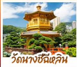
วัดนางซีฉีเสก