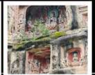
หินแกะสลักหนานคาน

PERIOD 1 : 13 - 17 ต.ค. 2569 PERIOD 2 : 17 - 21 ต.ค. 2569