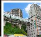
รถไฟกะลุดีทิก

ภูเขาควงอู๋ซาน (รวมกระเช้า) • อุทยานเหมิ่งชางซาน หินแกะสลักหนานคาน • ชมรถไฟกะลุดีทิก หงหยาดัง • ถนนคนเดินเจี๋ยฟางเป่ย์