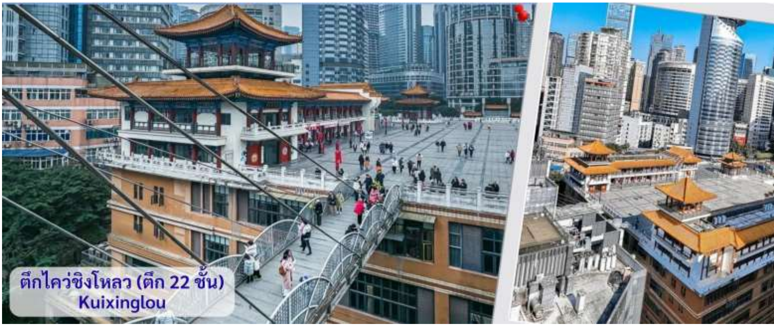
ตึกไควซิงโหลว (ตึก 22 ชั้น) Kuixinglou

จากนั้นอิสระถ่ายรูปหน้าตึกตะเกียบ ฉงชิ่ง(ด้านนอก) คือ ฉงชิ่งกั๋วไถอาร์ทเซ็นเตอร์ (Chongqing Guotai Arts Center) เป็นแลนด์มาร์กสำคัญที่มีสถาปัตยกรรมคล้ายตะเกียบยักษ์สีแดงและดำวางซ้อนกัน เป็นศูนย์จัดแสดงงานศิลปะและสถานที่ท่องเที่ยวที่นิยมสำหรับการถ่ายรูป โดยเฉพาะในเวลากลางวันเมื่อเปิดไฟสวยงาม สิ่งก่อสร้างอันมีเอกลักษณ์ อาคารนี้ถูกวางโครงสร้างให้มีรูปร่างคล้ายกอง "ตะเกียบยักษ์" สีดำและแดงที่วางซ้อนกันเป็นชั้นๆ ที่ส่วนปลายของตะเกียบสีแดงจะมีตัวอักษรจีนคำว่า "กั๋ว" ประทับอยู่ ซึ่งมีความหมายถึง ชาติหรือประเทศ ส่วนที่ปลายตะเกียบสีดำ จะมีอักษรจีนคำว่า "ไถ" ประทับอยู่ ซึ่งหมายถึง ความเรียบง่าย หรือความอุดมสมบูรณ์