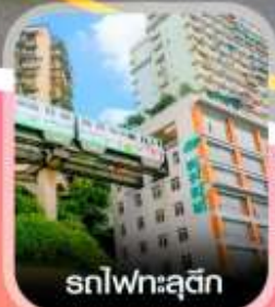
รถไฟทะเลสุติก

คอนเฟิร์มออกเดินทาง ทุกพีเรียด 2 ท่านขึ้นไป