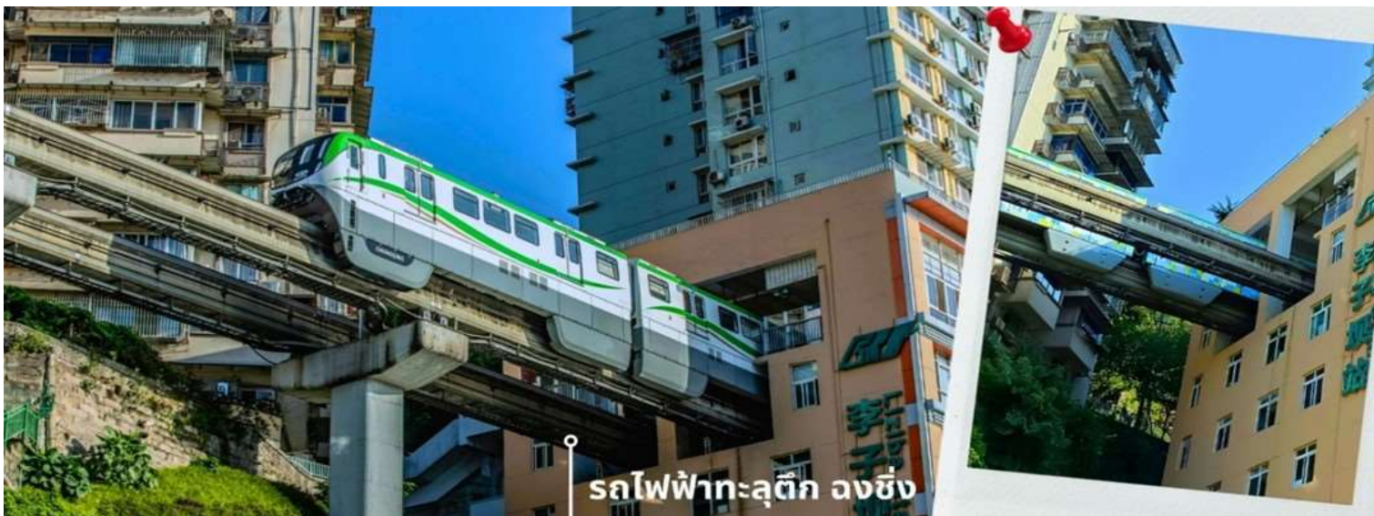
รถไฟฟ้าทะลุตึก ลงชิง

จากนั้นนำท่านนั่งรถไฟฟ้าทะลุตึก หรือ สถานี Liziba เป็นสถานีรถไฟฟ้าแบบขานชาลา สิ่งที่ทำให้สถานี Liziba มีชื่อเสียงไปทั่วโลกคือ “เส้นทางรถไฟที่วิ่งทะลุผ่านอาคารสูง 19 ชั้น” โดยมีระบบลดเสียงและแรงสั่นสะเทือน ทำให้ผู้ที่อาศัยอยู่ในตึกไม่ได้รับผลกระทบจากเสียงดังมาก กลายเป็นภาพอันน่าตื่นตาตื่นใจของผู้ที่มาเยือนซึ่งนักท่องเที่ยวที่เดินทางมาเป็นครั้งแรกผู้โดยสารบนขบวนรถไฟและผู้เข้าชมจากจุดชมวิวก็ต่างตื่นตะลึงไปตามๆกันกับการที่ได้เห็นรถไฟวิ่งทะลุตึกนี้ สถานี Liziba ได้รับการยกย่องให้เป็น 1 ในสถานที่สำคัญที่สะท้อนความเติบโตของจีนตลอด 70 ปี ซึ่งไม่ได้เกิดขึ้นโดยบังเอิญ รถไฟฟ้าทะลุตึกนี้คือตัวอย่างของความอัจฉริยะในการออกแบบการคมนาคมในเมืองภูเขาแห่งนี้ให้ท่านได้สัมผัสประสบการณ์กับการขึ้นนั่งบนรถไฟเพื่อผ่านทะลุตึกและเก็บภาพบรรยากาศ