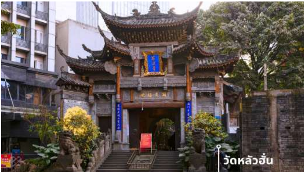
วัดหลัวฮั่น

นำท่านเดินทางสู่ วัดหลัวฮั่น (Luohan Temple) วัดสำนักงานใหญ่พุทธสมาคมแห่งนครฉงชิ่ง เป็นวัดเก่าแก่ที่สุดในฉงชิ่ง (Chongqing) ซึ่งสร้างขึ้นเมื่อ 1,000 ปีก่อน มีประวัติความเป็นมายาวนานเป็นจุดหมายทางศาสนาและเป็นศูนย์กลางของชาวพุทธในภูมิภาคการท่องเที่ยวที่สำคัญของภูมิภาค และเป็นแหล่งเรียนรู้ที่สำคัญของศิลปวัฒนธรรมจีน วัดนี้ประดิษฐานพระอรหันต์ถึง 500 องค์ แต่ละองค์มีลักษณะ ท่าทาง และสีหน้าแตกต่างกัน มีสถาปัตยกรรมแบบจีนโบราณที่สวยงามและละเอียดอ่อน พระอรหันต์ 500 องค์ แกะสลักด้วยหินและไม้ สะท้อนถึงความเชื่อในพุทธศาสนาและฝีมือศิลปะจีน