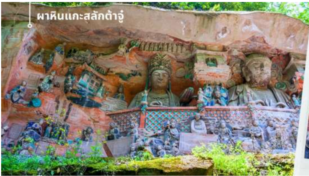
พาคินแกะสลักต้ำจู้