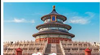
เจ้อฟ้าเทียนถาน

พระราชวังต้องห้าม - หอฟ้าเทียนถาน พิพิธภัณฑ์เบียร์ซิงเต่า - ไรไวน์ - วาฬเคียวคาย