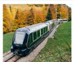
รถไฟโกลด์นพาส