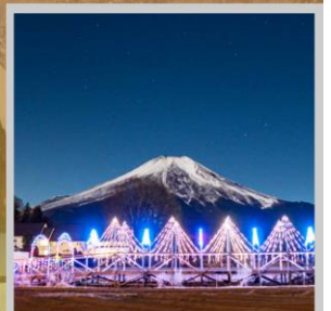
"YAMANAKAKO ILLUMINATION FANTASEUM"