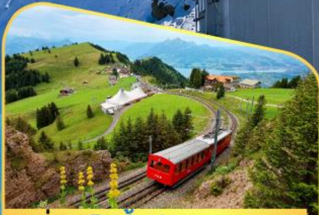
นั่งรถไฟขึ้นสู่ยอดเขาโรทิก